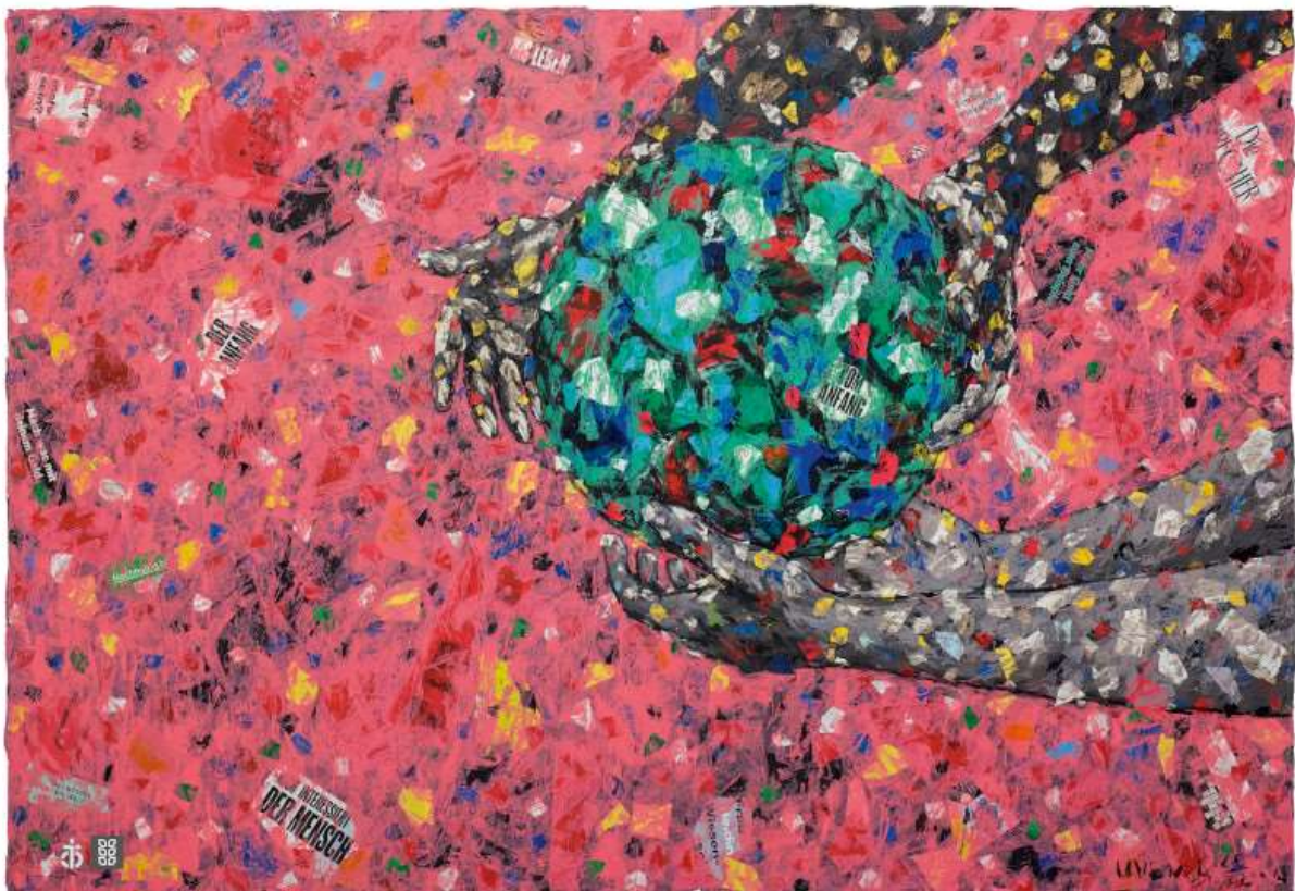
Bild: Fastentuch 2023 der ökum. HEKS-Kampagne